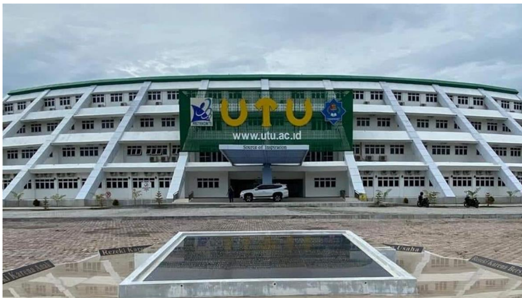
Gambar 1. Gedung Universitas Teuku Umar