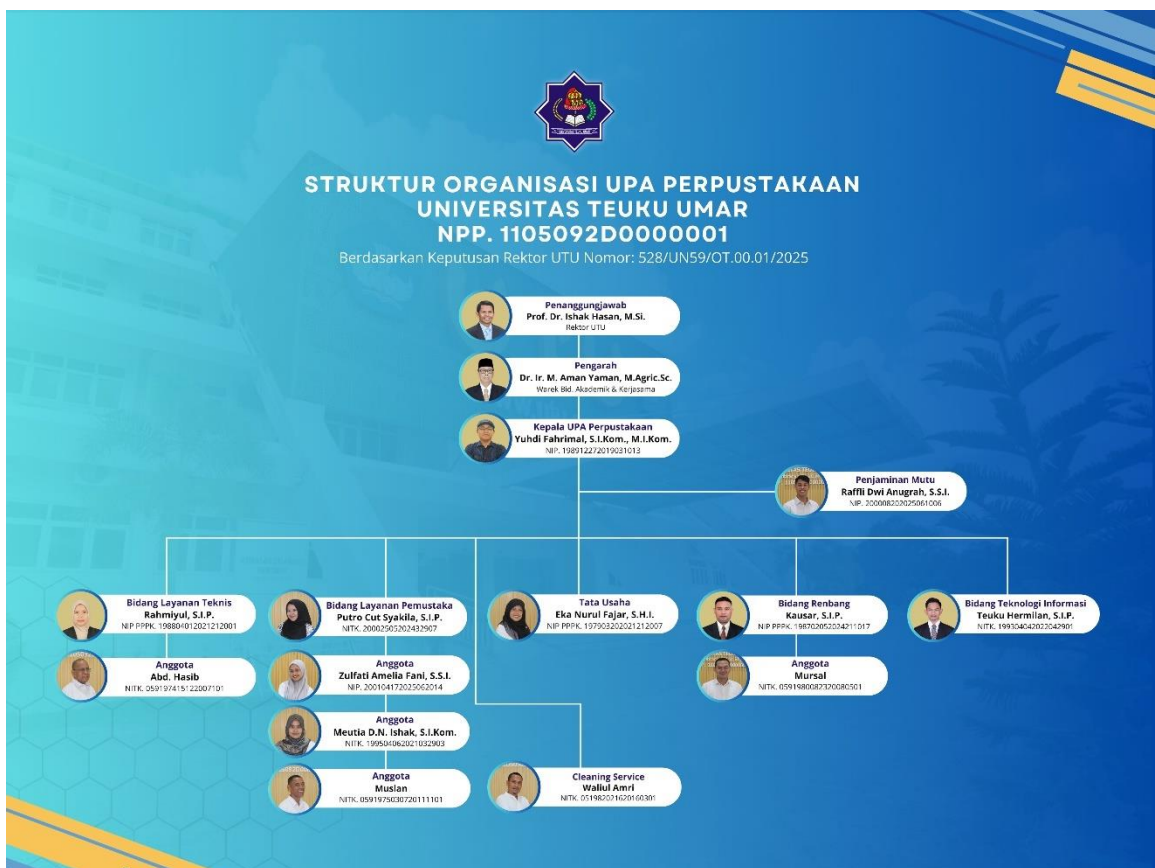
Gambar Struktur UPA Perpustakaan Universitas Teuku Umar